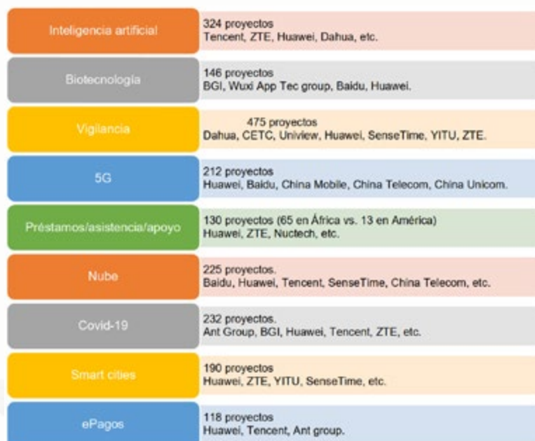
Figura 1. Tipo de proyectos de tecnología lideradas por empresas chinas fuera de China a octubre de 2022.