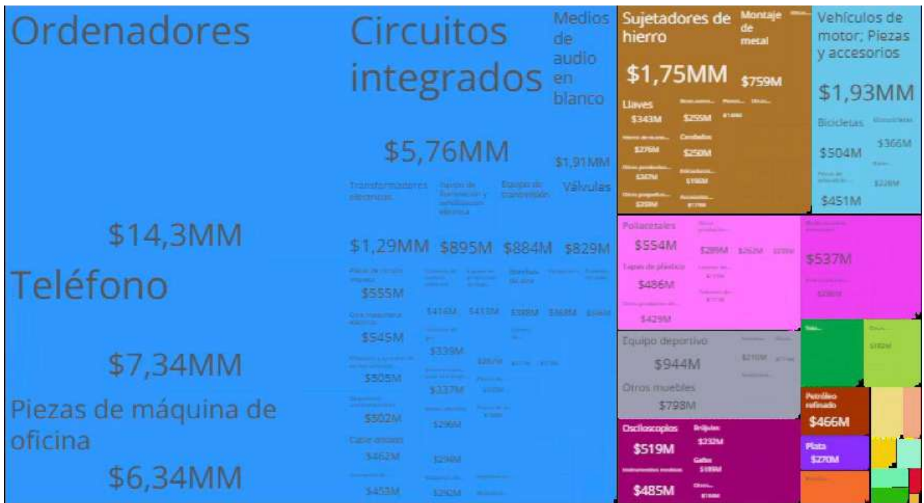
Figura 2. Bienes taiwaneses exportados a Estados Unidos 2025.

(Congreso de los Estados Unidos de América, 2025). De acuerdo con el Observatorio de Complejidad Económica (2026), la oferta exportable está constituida de la siguiente manera: circuitos integrados ($182MM), ordenadores ($28,8MM), teléfonos ($23,8MM), piezas de máquina de oficina ($15,9MM), y petróleo refinado ($10,4MM).