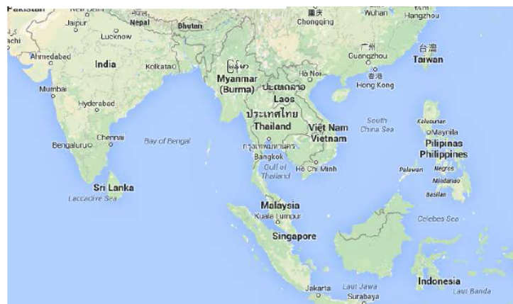
Fig. 1- Ubicación del Mar de China, y conexión con el Océano Índico y Pacífico.

En este sentido, el Mar Meridional posee una de las rutas marítimas más significativas del comercio mundial, ya que sus aguas dan acceso al Estrecho de Malaca que conecta el Mar de China Meridional con el Océano Índico. De este modo, gracias al mencionado estrecho se consigue la confluencia del mayor núcleo de población mundial al entrelazar el subcontinente indio y Asia-Pacífico (Mackinlay, 2012:404). No obstante, lo más importante es que dicho estrecho es la vía por donde los países de la región se abastecen de todo tipo de materias y productos procedentes de África, Oriente Medio y Europa (esta última conectada por el Canal de Suez); al igual que exportan sus productos a dichas regiones. Siendo, por tanto, vital para China. No en vano, por medio del estrecho de Malaca, China actualmente recibe más de la mitad de sus recursos energéticos (Delage, 2014:233). Por último, pero no menos importante, otro factor relevante del mencionado mar es su riqueza en hidrocarburos y recursos pesqueros (Carrasco, 2007). De ahí, el inusitado interés por controlarlo.