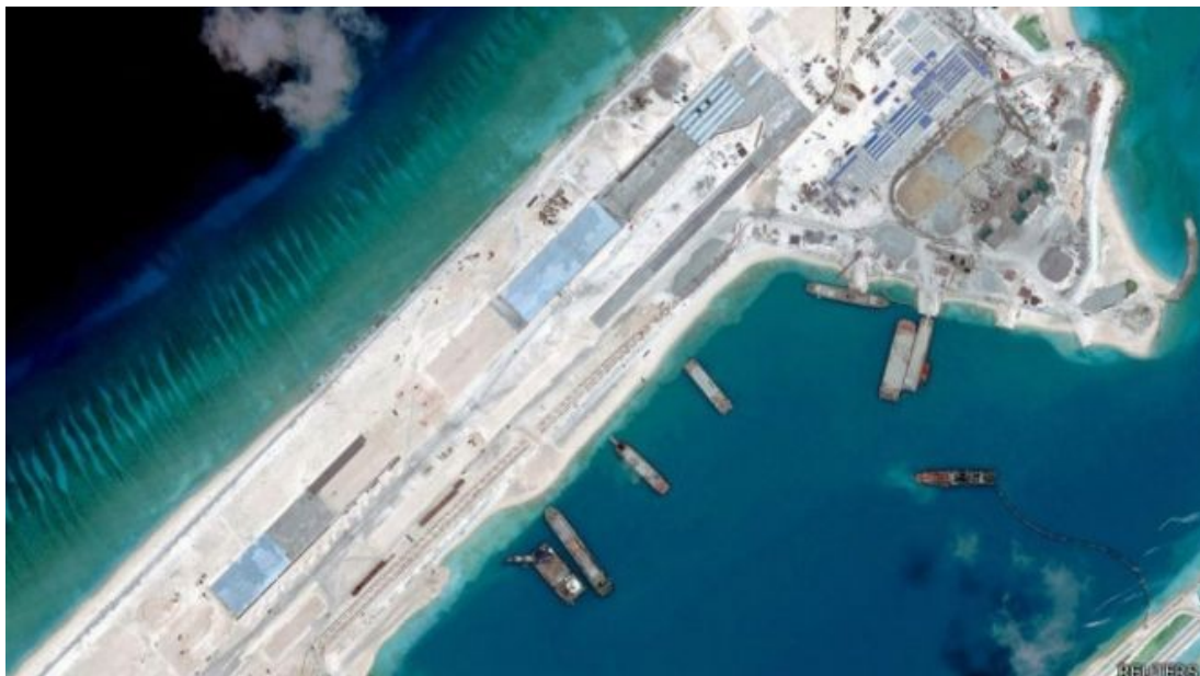
Fig. 3- Imagen desde un satélite de la construcción de una pista de aterrizaje de más de 2900 metros de largo, ubicada en una isla artificial de las Spratly

En esta línea, China está forzando dicha situación, ya que ha iniciado una serie de construcciones en las islas, especialmente de carácter logístico como pistas de aterrizaje y puertos (Hayton, 2015). No obstante, lo más preocupante, es que para tal fin está uniendo atolones u arrecifes con la idea de construir islas artificiales. No en vano, China carece de una isla propiamente dicha en las Spratly, a diferencia de Vietnam, Taiwán y Filipinas (Corral, 2016).