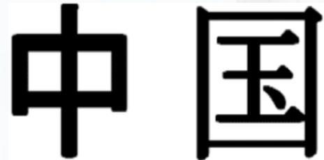
Figura 2: China en caracteres

La tradición y cultura están presentes dentro de los planos económicos, políticos e incluso dentro de las percepciones sobre cómo desarrollar su Inteligencia estratégica. Esto se puede notar en cómo China se ve a sí misma. Pese a esa noción de debilidad, aparentemente reciente y especialmente dada después de los tres grandes golpes que sufrió a finales del siglo XIX - la Guerra del Opio, la guerra con Japón y la sublevación de los bóxers- China presenta un fuerte nacionalismo. En las figuras de cómo se representa China se encuentra que el primer carácter zhong es centro y guo es país, esto da como resultado la idea de “el país del centro”, ¿del centro de qué? un poco del centro del mundo. En esta dialéctica, en donde China en sí misma es un mundo aparte y que ha intentado incluso en etapas históricas autoencerrarse en sus propias fronteras, hay que entender que por varios procesos de todo tipo (culturales políticos etc.), se puede concluir, como lo hace Pieke en su trabajo sobre el Estado chino, que en China el Estado es sociedad. (10)